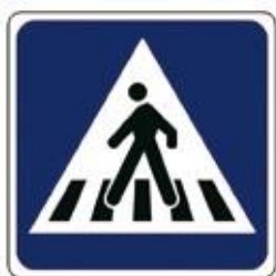
Prehod za pešce