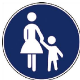
Steza za pešce

Otroci bi morali poznati predvsem prometne znake, ki pešce obveščajo o varni hoji, jim zapovedujejo ravnanje ali prepovedujejo hojo.