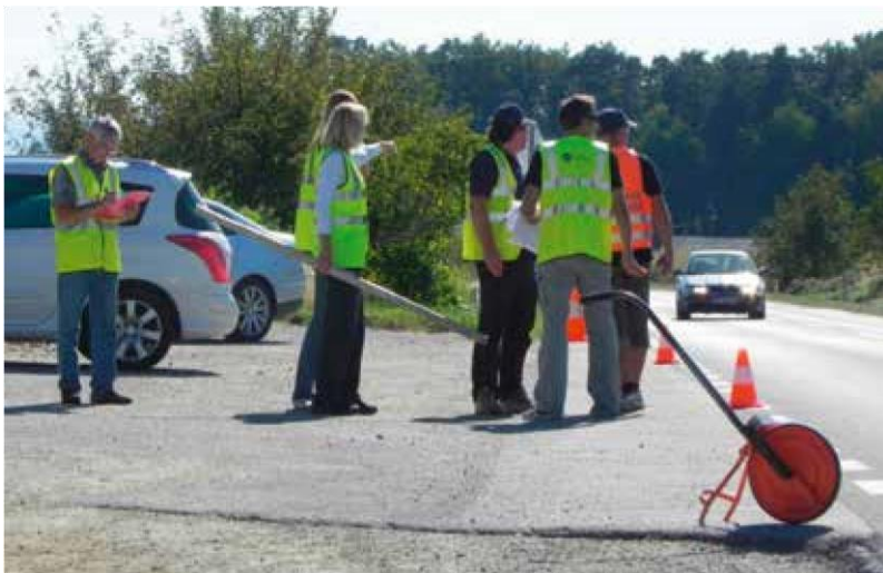
Terenska presoja varnosti šolskih poti

Ukrepi za varnejšo prometno infrastrukturo in večjo varnost otrok na šolskih poteh prinašajo dolgoročno tudi znatne prihranke lokalnih skupnosti na področju organiziranih šolskih prevozov, hkrati pa pripomorejo k učinkovitem in aktivnem vključevanju otroka oziroma šolarja v svet prometa.