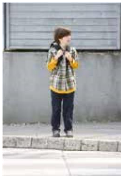
2. Pogledam na levo