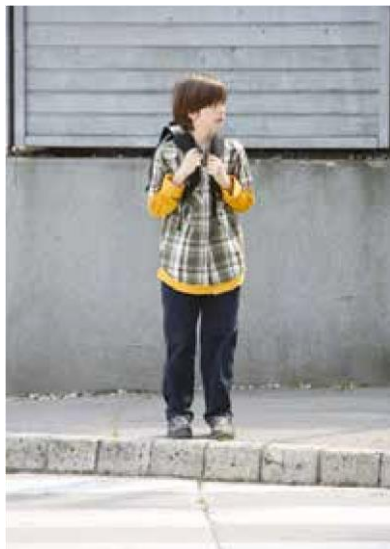
Šolar na pločniku