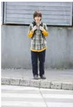
1. Ustavim se na robu pločnika

Potem, ko se prepričamo, da se otrok zna ustaviti ob robu pločnika in opazovati promet, začnemo z najtežjim delom, prečkanjem ceste. Prva prečkanja naj bodo na ozki, neprometni cesti. Poseben problem je, ker otrok ni sposoben ugotoviti razdalje in hitrosti vozil. Zato ga navajamo na to, da prečka cesto le, če z obeh strani ne prihaja nobeno vozilo ali takrat, ko voznik ustavi in mu jasno pokaže, da lahko prečka cesto.