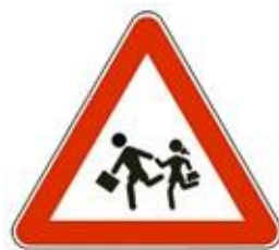
Otroci na cesti

Prometni znaki s svojimi barvami in simboli otroke vedno pritegnejo. Brez težav se naučijo njihova imena, več problemov pa imajo pri tem, kako je potrebno ravnati. Nekaj znakov otroke izredno moti in jih razumejo popolnoma narobe. Simbole si razlagajo po svoje in tako tudi ravnajo. Najbolj znan znak, ki spodbuja otroke k napačnem ravnanju, je znak Otroci na cesti, ki opozarja voznike, da prihajajo na območje, kjer so na cesti pogosto otroci. Zaradi simbola dveh otrok v teku pa ga otroci lahko razumejo tako, da je treba pri tem znaku steči čez cesto.