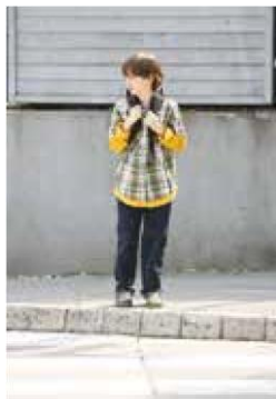
3. Pogledam na desno