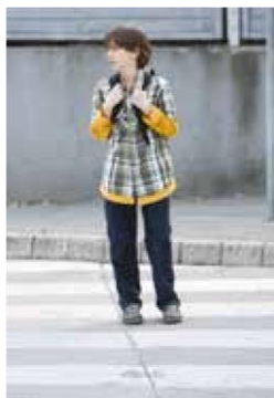
6. Na sredini ceste še enkrat pogledam na desno.