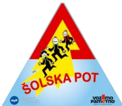
Prometni znak šolska pot (3502)

Pomemben prispevek na področju varnejših šolskih poti predstavlja tudi pravilno označevanje le teh z vertikalno in horizontalno prometno signalizacijo. V zvezi s tem je stopil v veljavo Pravilnik o prometni signalizaciji in prometni opremi, ki med drugim opredeljuje nov prometni znak »šolska pot«, ki mora biti postavljen skladno z načrtom šolskih poti na cesti oziroma njenem delu, kjer poteka šolska pot, izvedba znaka pa je dopustna tudi kot troznak ali zastava (pravokotni »beach flag«).