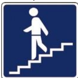
Podzemni prehod za pešce