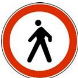
Prepovedano za pešce