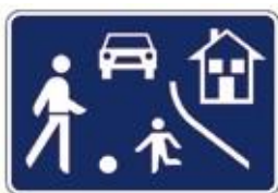
Območje umirjenega prometa

Policist je na cesti zato, da otrokom pomaga in jih varno usmerja v prometu. Grožnje, da ga bo videl ali celo kaznoval policist, če naredi kaj narobe, zato niso primerne.