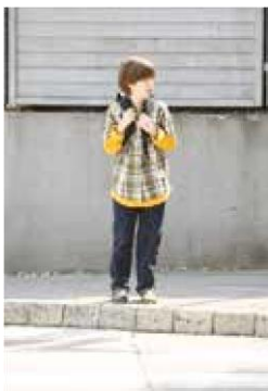
4. Še enkrat pogledam levo